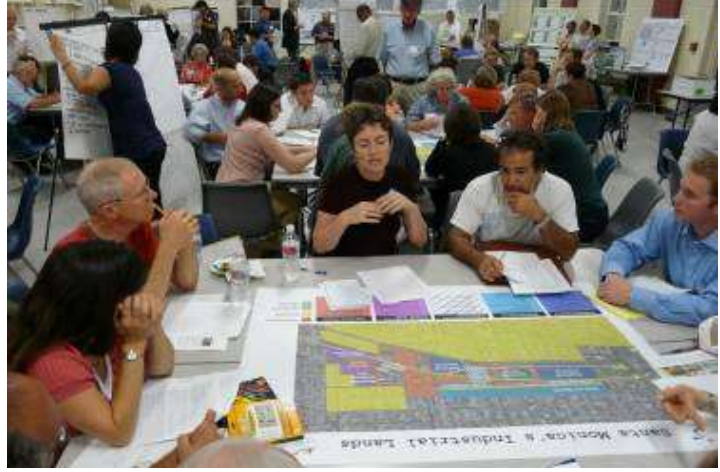
Belde Halkına Ulaşma Programı (Santa Monica)